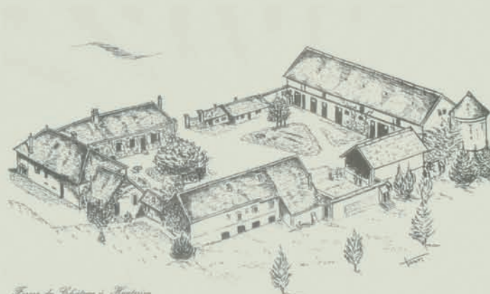
F. de la Chapelle